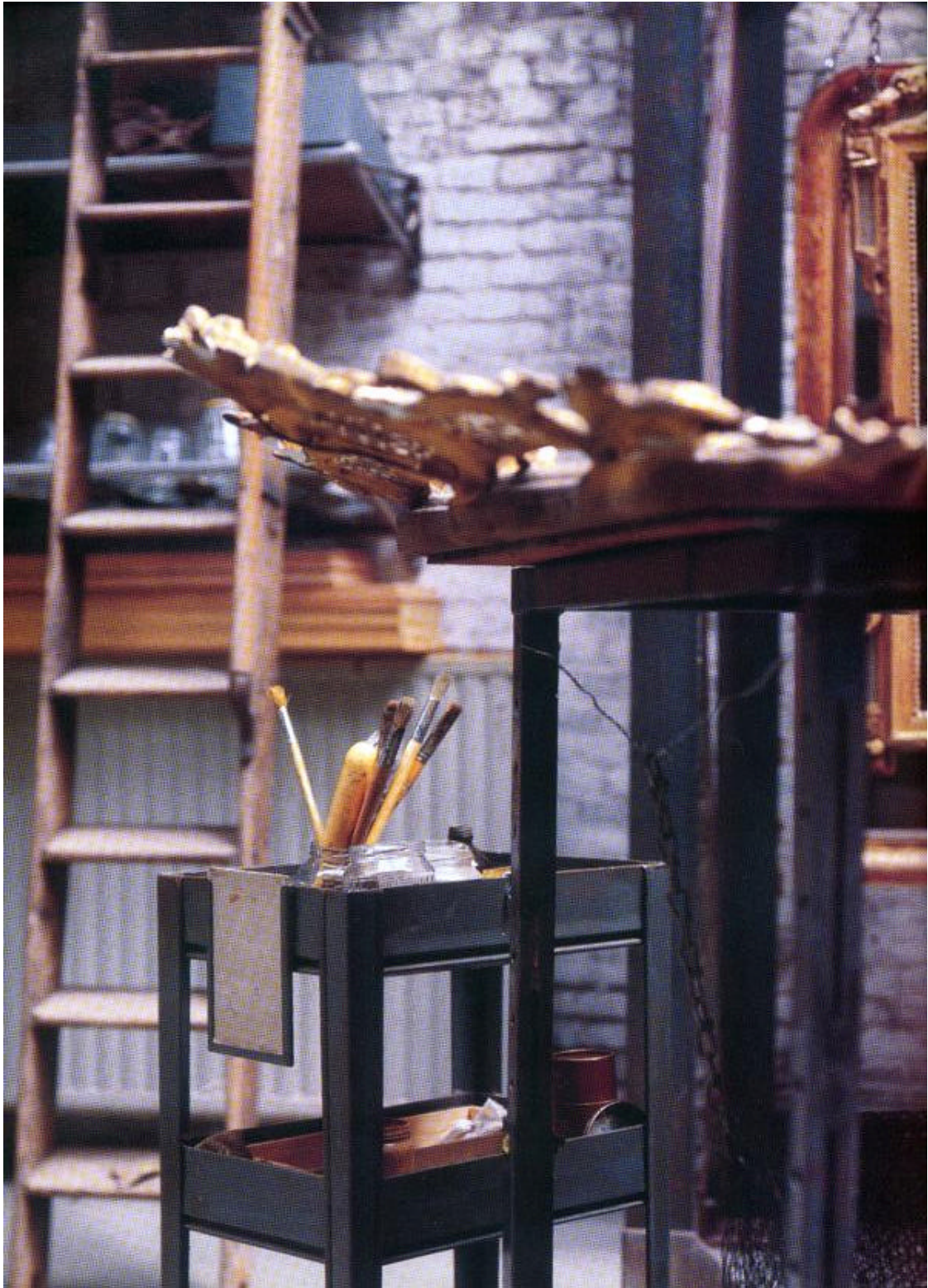
Patineerkarretje in het restauratieatelier.